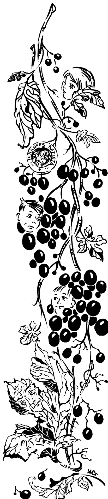
Рисунок И. Старцевой.