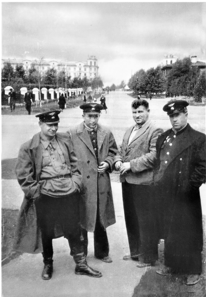
Летчики в городе имени летчика-героя А.К.Серова (перекресток ул. Л.Толстого и ул. Октябрьской революции).