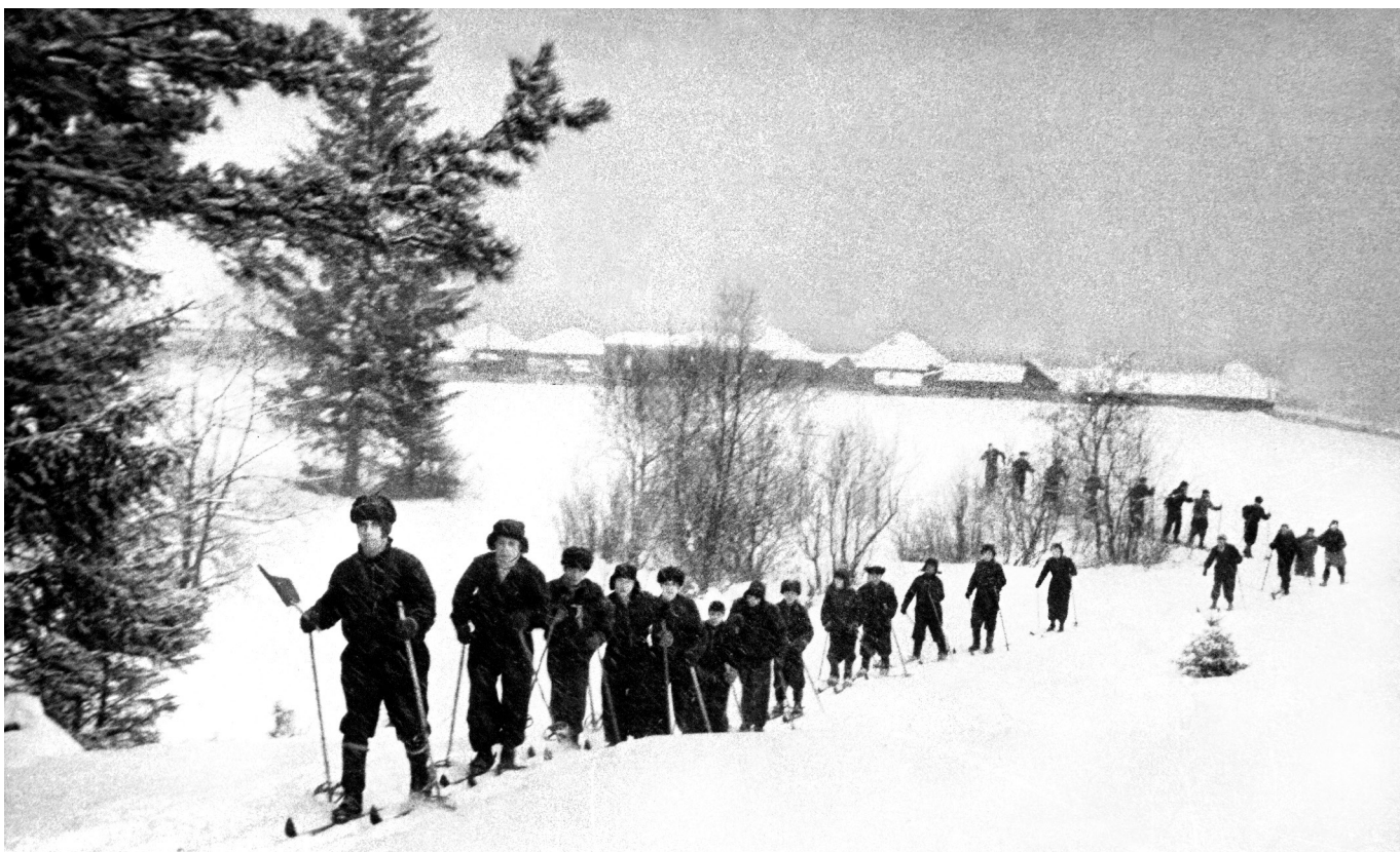
Турпоход выходного дня металлургов.