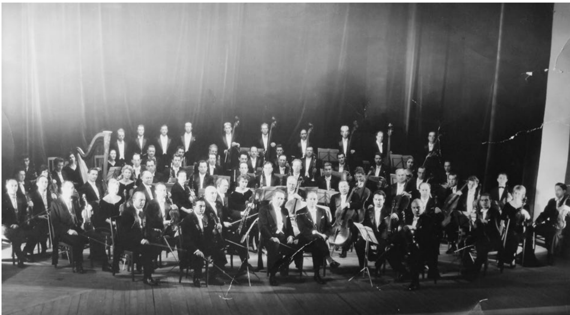
Свердловский государственный симфонический оркестр. 1960-е гг.