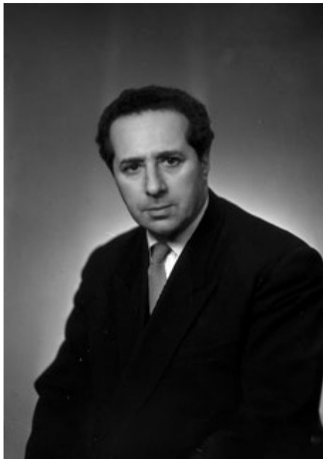
М.И.Паверман. 1957 г.