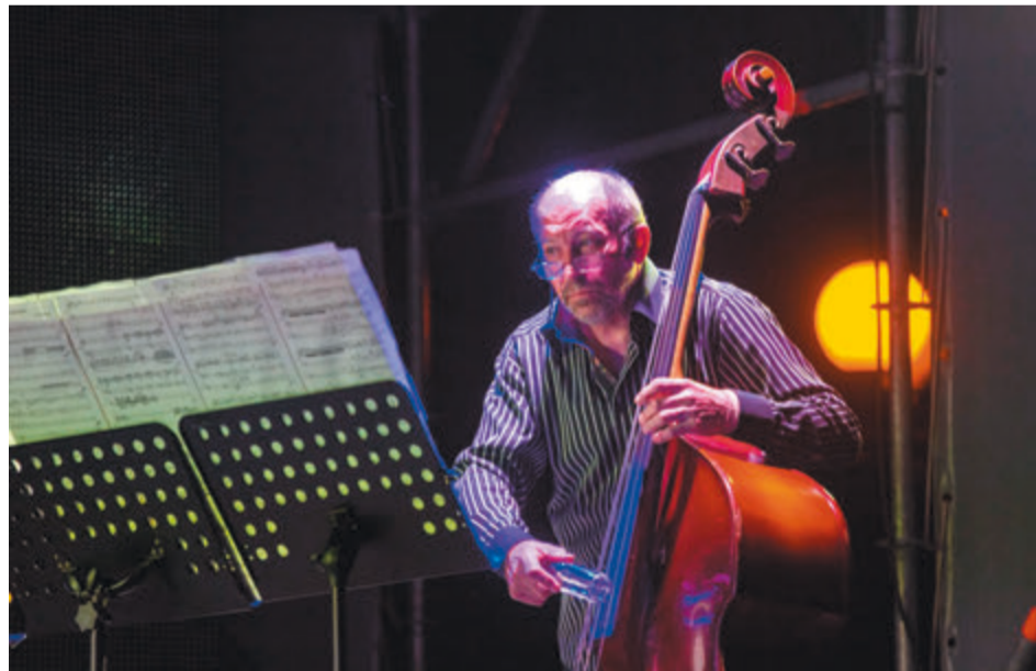
Международный фестиваль современной академической музыки в Нижнем Новгороде. 2015 г.