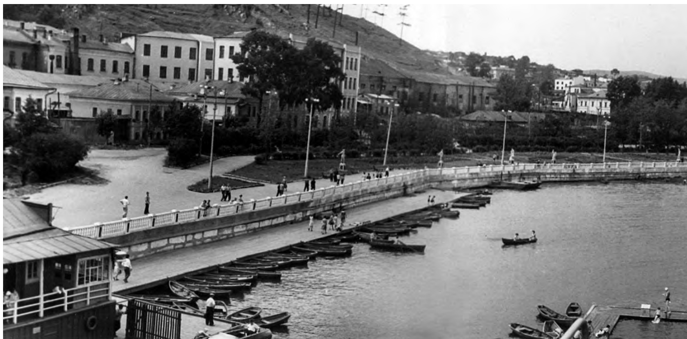
Вид на техникум им. Аносова и танцплощадку.

вал, те играли в любимые игры – баскетбол, волейбол до позднего вечера.