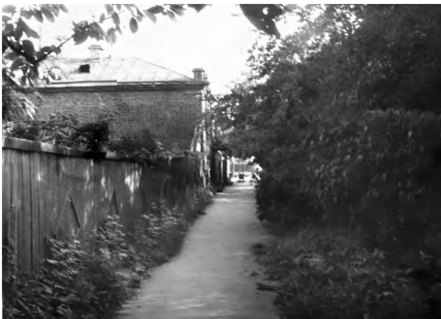
1980-е. Тротуар улицы Розы Люксембург возле домов №№ 51 и 53, выводящий к улице Куйбышева через придорожные заросли сирени. На этом самом месте пущенная под землей речка Малаховка пересекает «Розочку». (Сейчас здесь повсюду гранит, бетон и огромные современные здания, а речка все там же, в подземном коллекторе...)

будучи циркачами, «неимоверно сильны физически» и, к примеру, взрослого мужика в схватке легко могут уложить на обе лопатки. ...Захотелось проверить (а заодно и развлечься), тем более, что сделать это было несложно, так как все артисты цирка, в том числе и лилипуты, каждый день ходили по Розы Люксембург из «Централь-