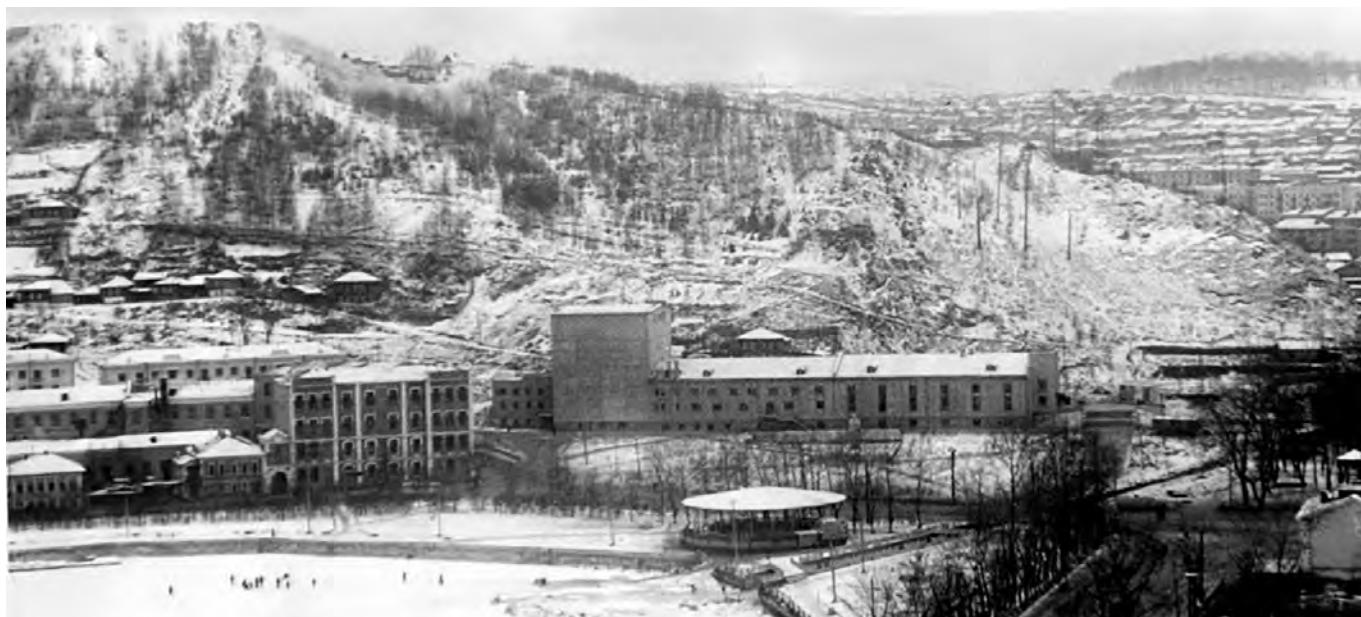
Вид на танцевальную площадку. Построена в 1950-е, снесена в 1990-е годы.

Я очень любил танцевать. Танцевать начал в 1946 году, в 16 лет. Ходил «по благу» на танцы бесплатно (билет стоил 3 рубля), на входе был пленный немец. Первый год посещения танцплощадки мы стояли в углу, старались шевелить ногами. В одном углу стояли ребята, в другом – девчата. Сначала стояли и присматривались, учились. Позднее стали танцевать. У танцплощадки была аллея акаций, родители наши могли постоять, посмотреть на свое чадо – кто как себя ведет. На танцах была живая музыка – барабан, баян, аккордеон. Помню, Зверевы здорово играли. К 1947 году взрослые ушли с танцплощадки, она стала молодежной. Рядом, за танцплощадкой, была волейбольная площадка. Вверху, где контора связи, заливали зимой каток, и еще там было стрельбище, где сдавали нормы ГТО. Летом можно было играть в футбол, танцевать, а зимой катались на катке. Получалась целая культурно-спортивная зона: кто не танце-