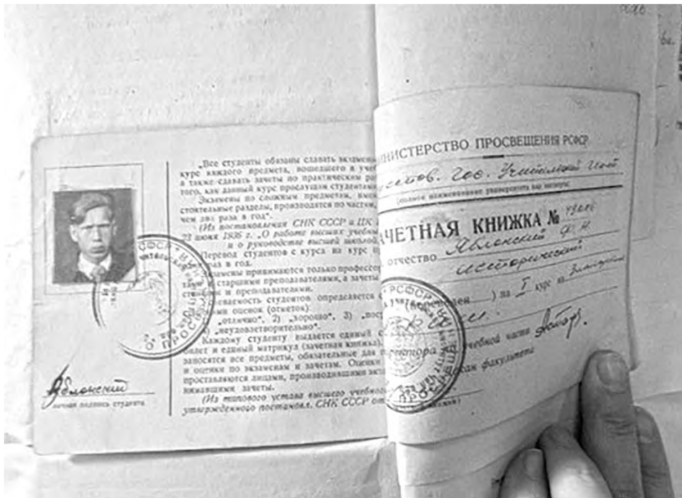
Зачетная книжка Ф.Н.Яблонского, сентябрь 1949 г. АЗГО, Р-364, оп. 2, д. 31, Личные дела.