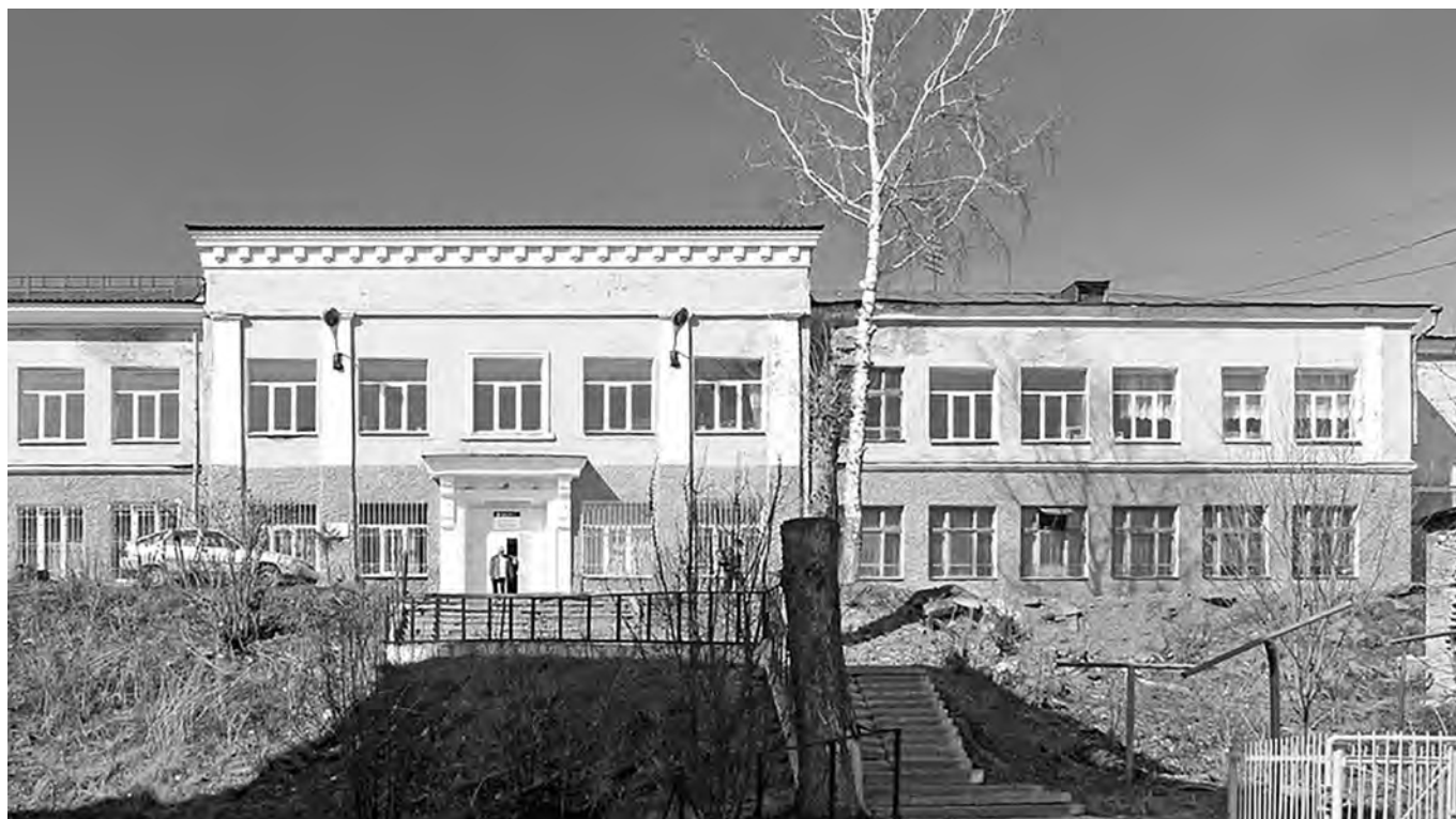
Эвакогоспиталь 3868, позднее – Златоустовский учительский институт. Златоуст, ул. Октябрьская, дом 6.