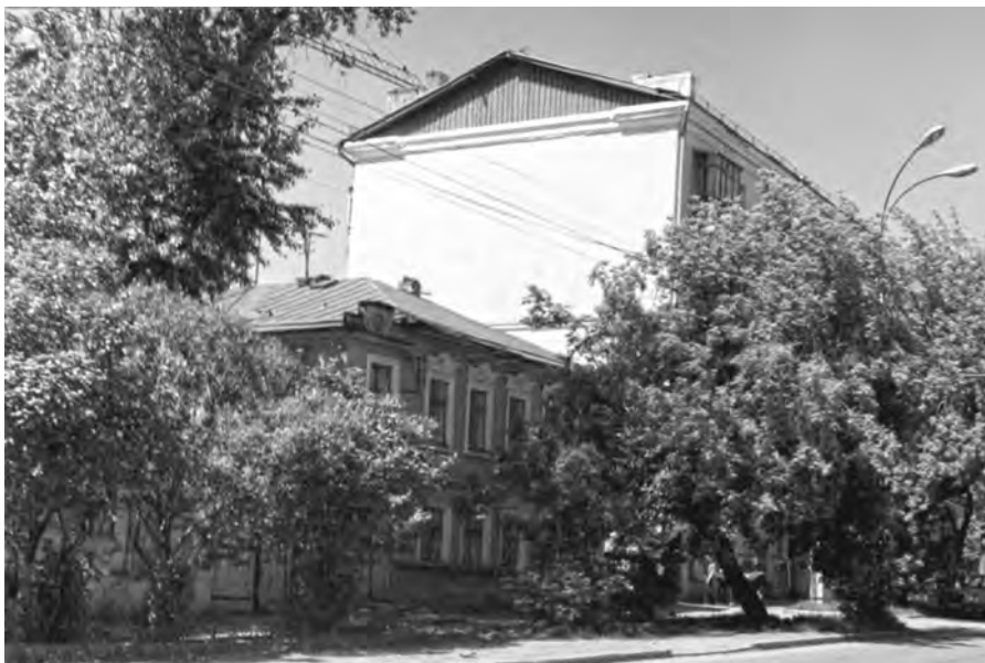
Солнечные улочки детства. «Розочка» в те времена, когда движение по ней было совсем слабым. Дома №№ 42 (на переднем плане) и 40 (добротная пятиэтажка постройки 1950-х с полнометражными квартирами и «Булочной» с замечательными пирожками с «повидлой» на первом этаже).

Конечно же, эти удивительные артисты не могли не привлечь внимания местных мальцов, которых однажды кто-то «просветил», что лилипуты только с виду маленькие, но на самом деле они,