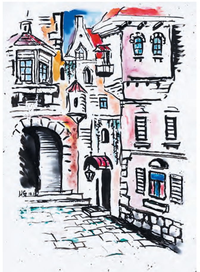
И.Старцева. Мои чужие города.