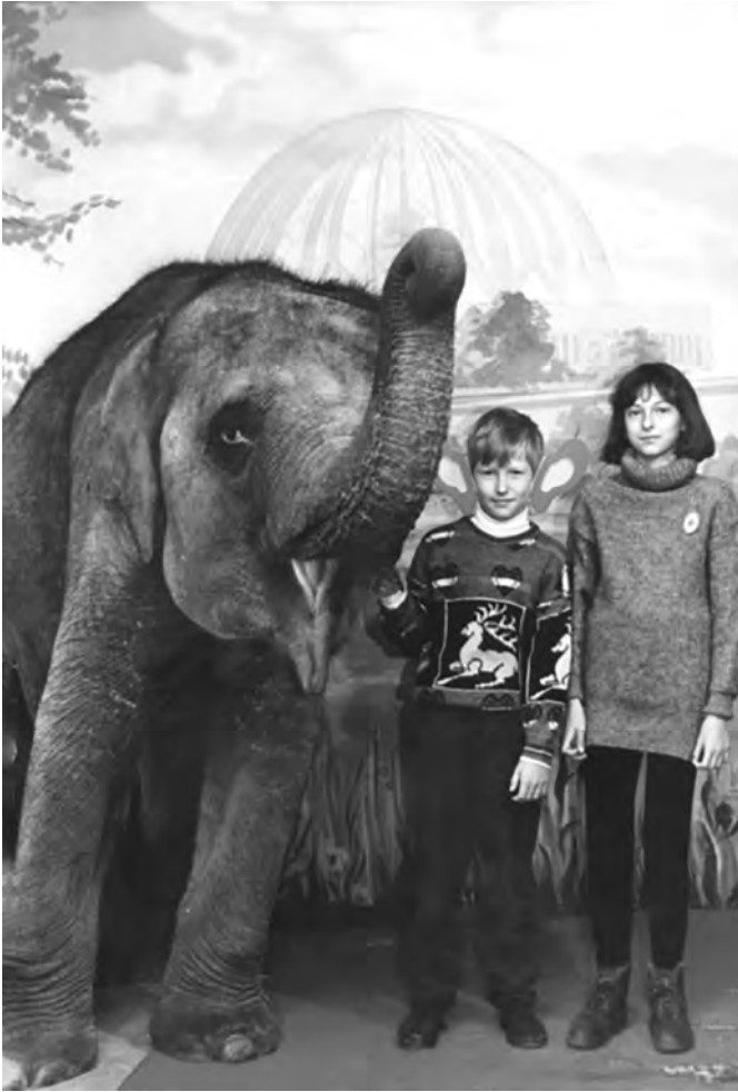
В новом Свердловском цирке. 1990-е...

конце улицы Свердловского безалкогольного комбината неспешно развозили на телеге дедки-возчики), а по вечерам и в выходные ребяшня вообще превращала полностью освобождающуюся от машин дорогу в игровую площадку: никакого шума моторов, только звонкие ребячьи голоса, изредка перекрывавшиеся резким, «озабоченным» криком гражданки Трусовой, проживавшей на верхнем (втором) этаже 42-го дома: «Борька», бутылку-то купил?» Ну, понятно, что не бутылку лимонада или газводы «Колокольчик»...) Вот этого «велоспортсмена» ребята и решили избрать объектом для своей «проверки на дорогах»: «пацаны, навалимся на лилипута из кустов, когда он будет проезжать мимо, а там посмотрим, кто кого!»