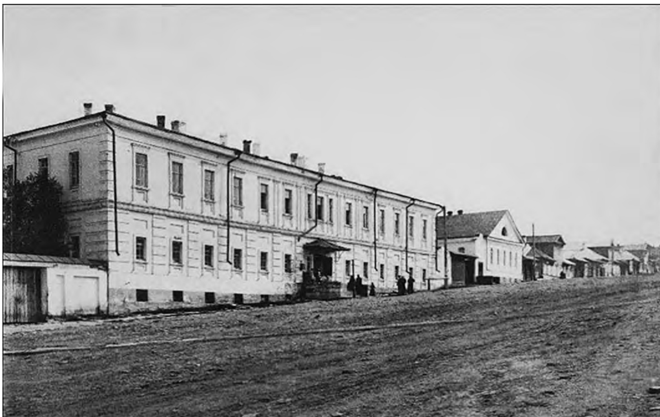
Горнозаводской госпиталь в Златоусте. Фотография начала XX века из архива златоустовского краеведа С.Волокитина.

Главный специалист архивного отдела администрации ЗГО И.Б.Шубина дополняет информацию сведениями из документов архива Златоустовского городского округа (АЗГО): «В связи с реорганизацией Златоустовского педагогического училища с 1 августа 1939 года в городе начал работу Златоустовский учительский институт. Его основной задачей была подготовка учителей 5–7