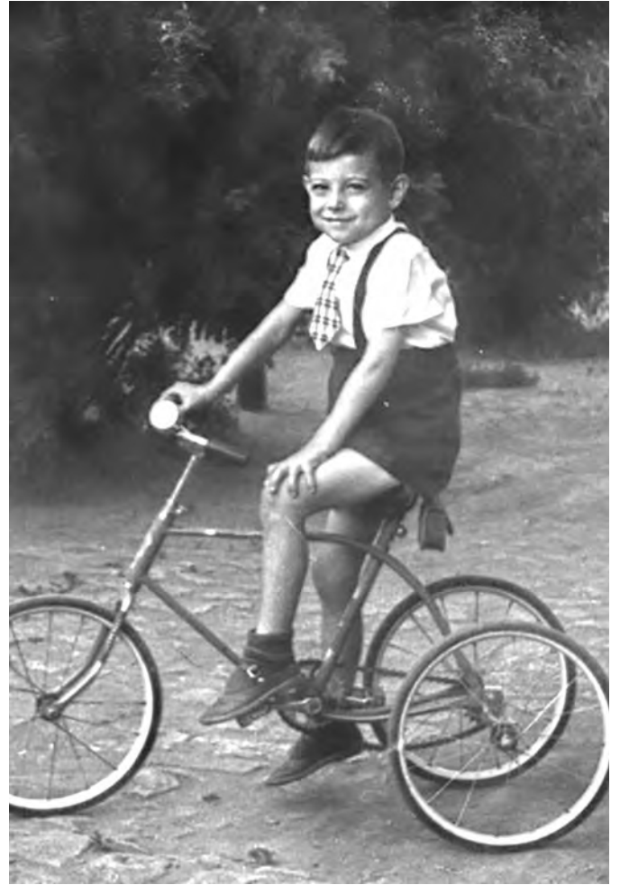
Детский комбинированный велосипед, середина 1960-х. (В уютном зеленом дворе дома № 45 по улице Розы Люксембург, где и проходило мое счастливое детство).

...И в один теплый летний день целая ватага малолетних «кулюганов» затаилась в густых придорожных зарослях акации и сирени перед мостом через Малаховку (небольшую, вроде ручья, речку, недавно, года за три-четыре до того пущенную по подземному коллектору), поджидая «грозного циркового силача». Вскоре послышался жалобный, пронзительный скрип детского двухколесного велосипеда (такие «машины» изначально продавались в трехколесном варианте, но когда ребенок немного подрастал, их можно было превратить в двухколесные, сняв одно