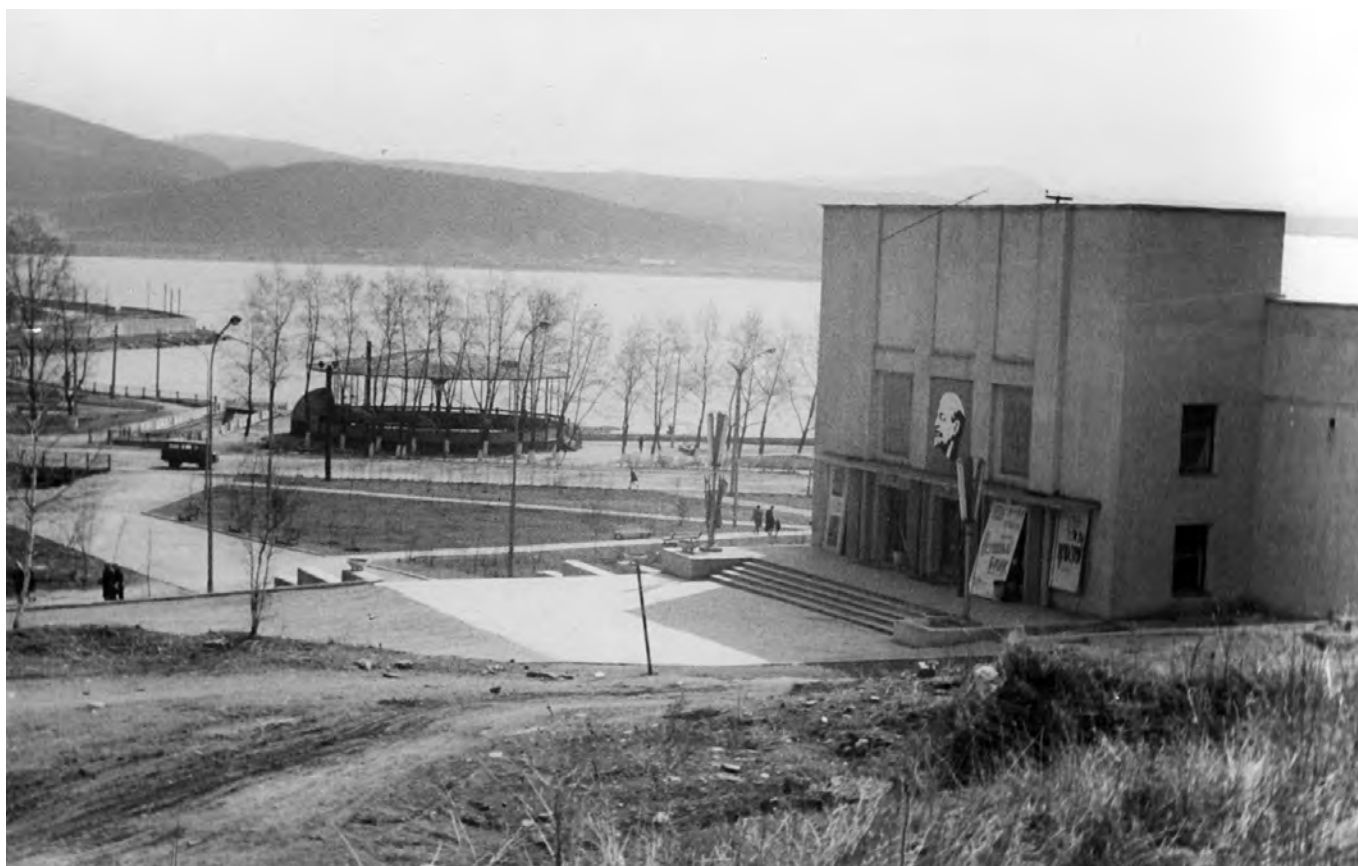
Драмтеатр и танцплощадка.