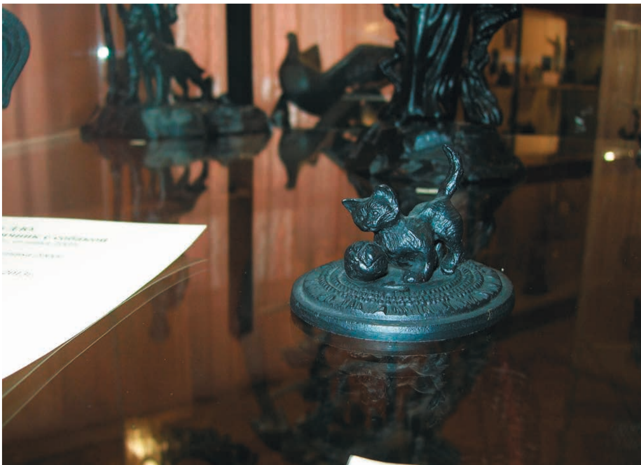
Е.В.Зимина. Котенок, играющий с клубком. Отливка 2017 г. Чугун. 4x6,5x5,5 см. Каслинский историко-художественный музей.

– Это зависит от аудитории. Детей и юношей привлекают в каслинском литье изображения животных. Какие-то сказочные персонажи, которые им знакомы с раннего детства. Взрослых же восхищают тонкость проработки деталей, качество покраски, отделки и, конечно, же произведения, которые олицетворяют наше государство. Нельзя не упомянуть в этом плане скульптуру «Россия», целый ряд произведений, кото-