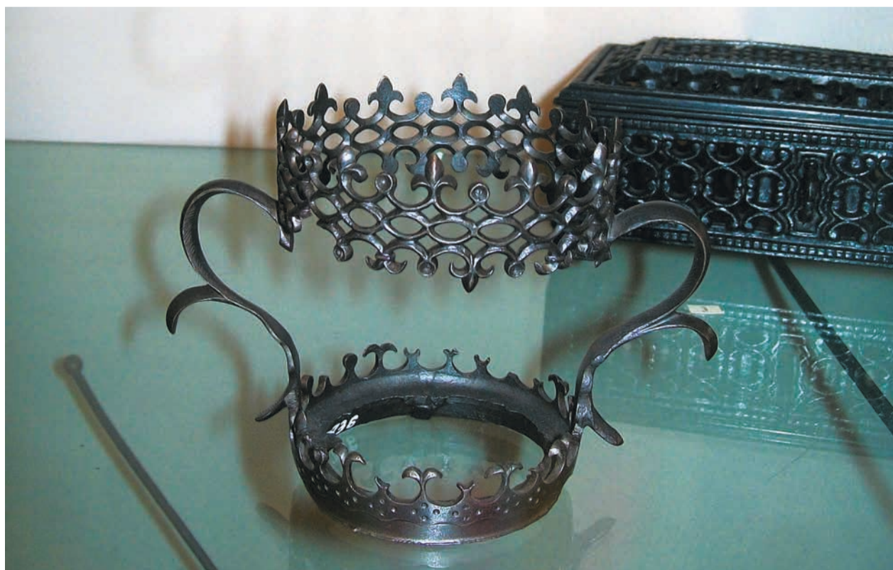
О.А.Скачков. Подстаканник с двумя ручками. Отливка 1978 г. Чугун. 9x13x10 см. Каслинский историко-художественный музей.