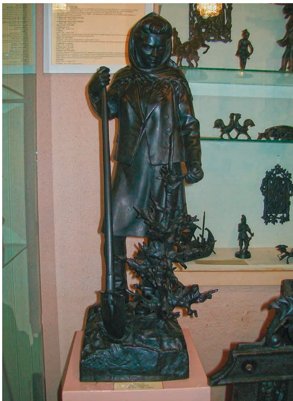
А.С.Гилев Лесопосадчица. Отливка 1950 г. Чугун. 77,5x23x22,5 см. Каслинский историко-художественный музей.