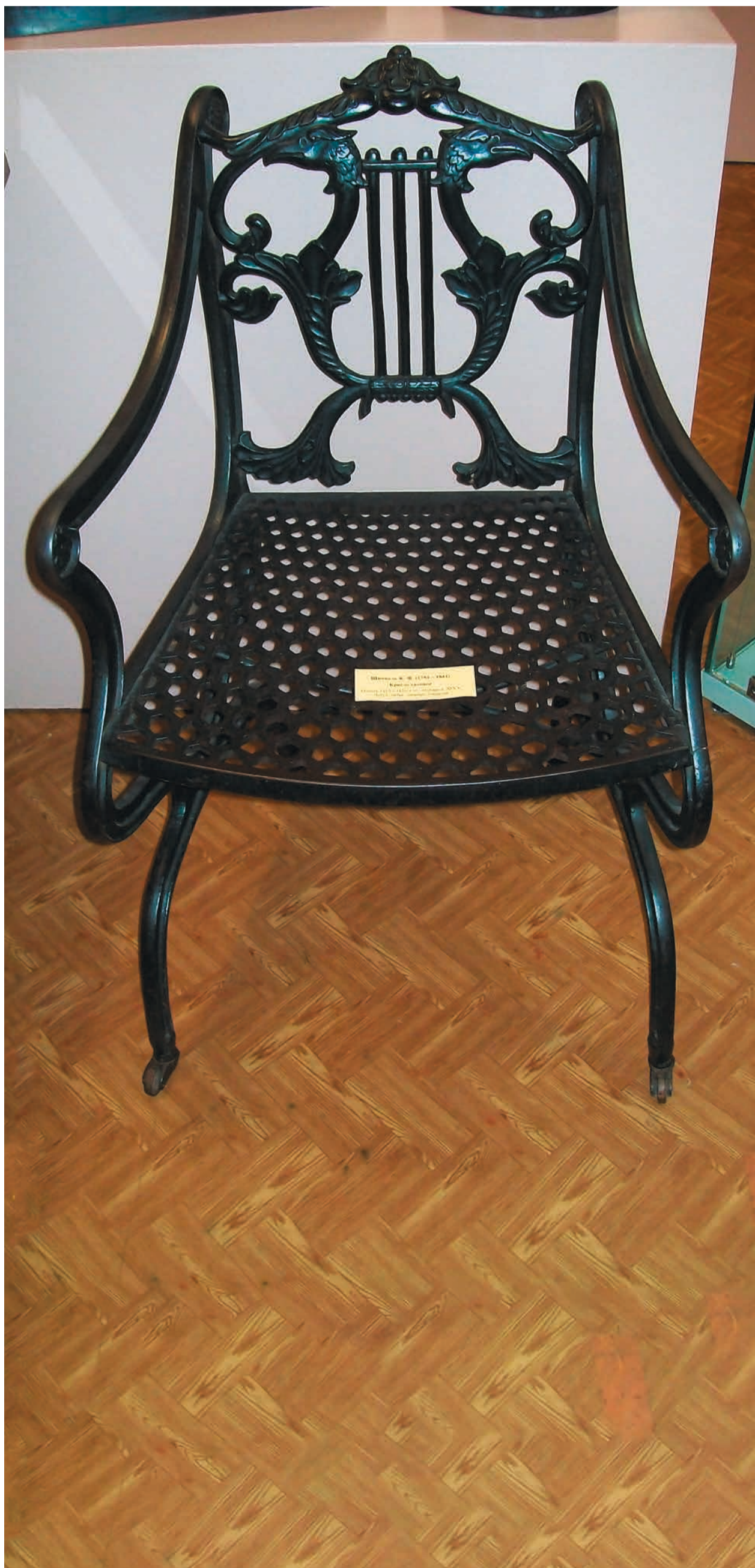
К.-Ф.Шинкель. Кресло садовое в стиле классицизма. Отливка кон. XIX в. Чугун. 88x55x55 см. Каслинский историко-художественный музей.

– Ваш музей уникальный, единственный в России?