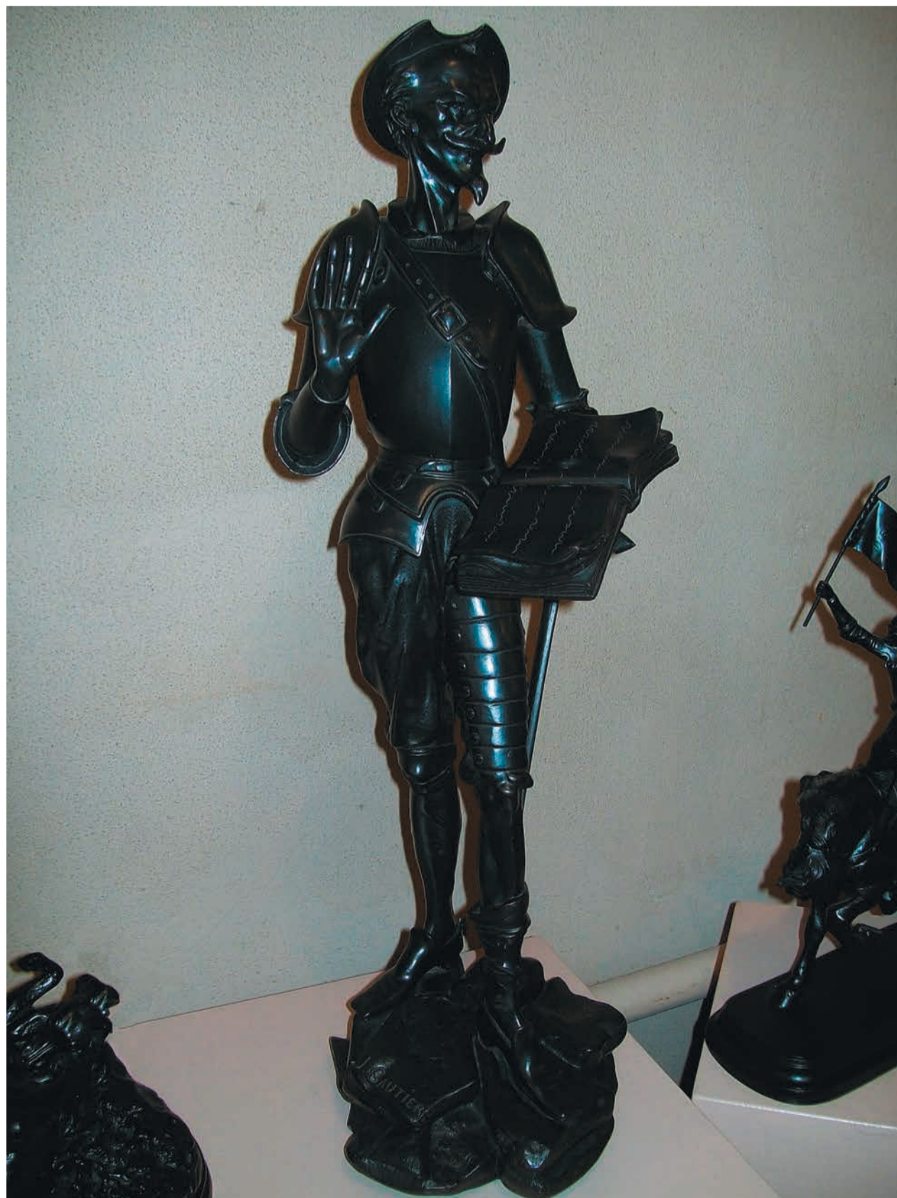
Ж.-Л.Готье. Дон Кихот. Отливка 1930-х гг. Чугун. 24,5x22x71,5 см. Каслинский историко-художественный музей.