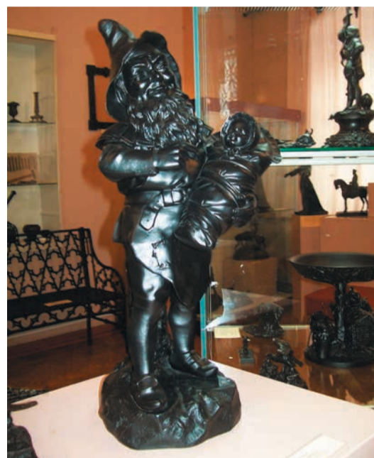
Н.Мейер. Гном с ребенком. Отливка 2017 г. Чугун. 58x19x18,5 см. Каслинский историко-художественный музей.

– В основном, за счет даров. Конечно, в последние десятилетия выделялись средства на приобретение новых образцов художественного литья, благодаря чему мы в 2017 году смогли купить произведения, созданные по моделям XIX века. Помимо основного предприятия – Каслинского завода архитектурно-художественного литья, который является правопреемником многовекового производства, которое здесь существовало, здесь имеется предприятие «Каменный пояс» и семейная литейная мастерская Катыхевых, у которых нам удалось приобрести несколько скульптурных произведений. Но чаще всего жители Каслей приносят нам в дар различные предметы исторической направленности. И, конечно же, произведения художественного литья.