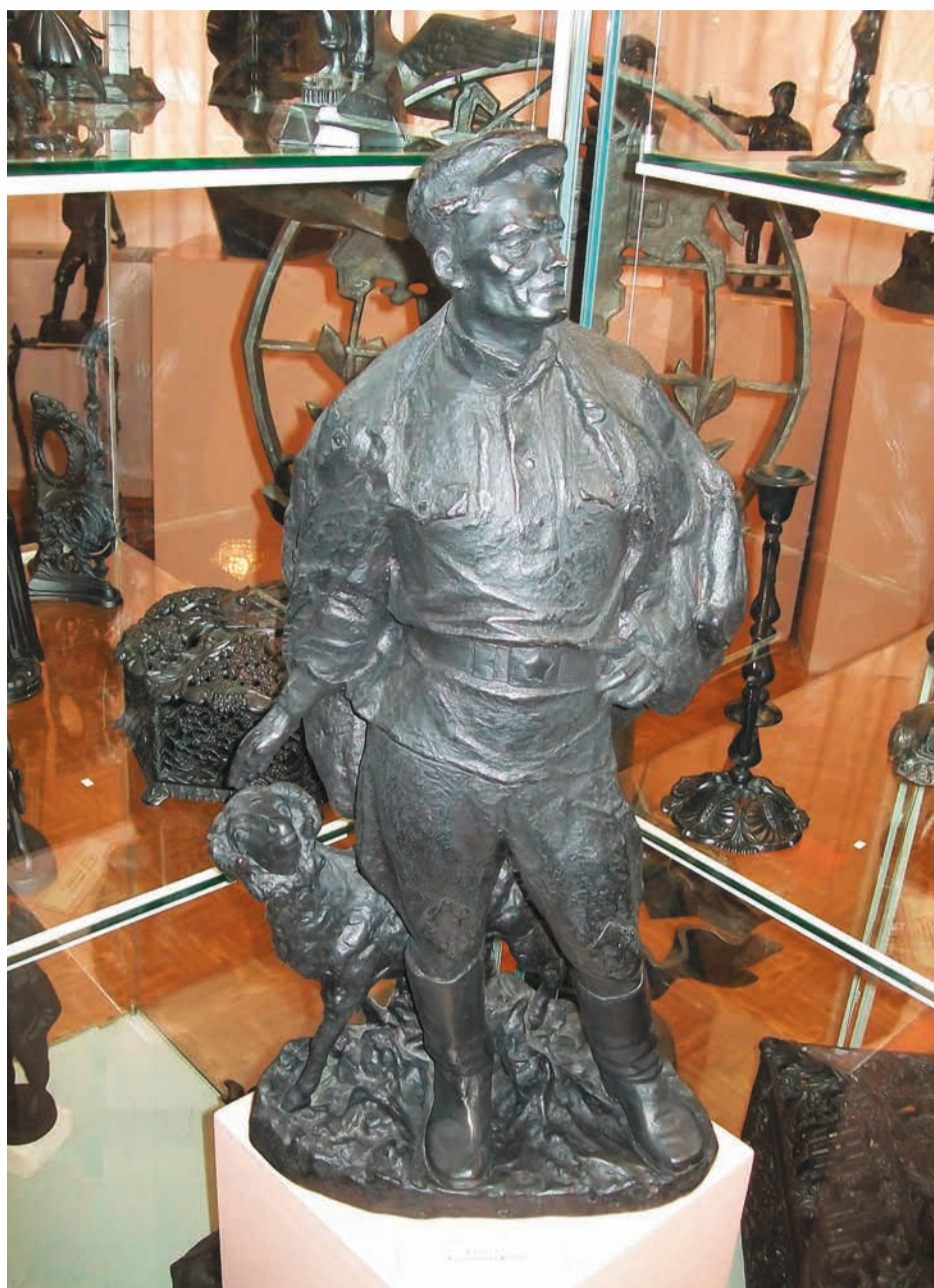
А.С.Гилев. Животновод С.Н.Уфимцев. Отливка 1961 г. Чугун. 70x48x32 см. Каслинский историко-художественный музей.