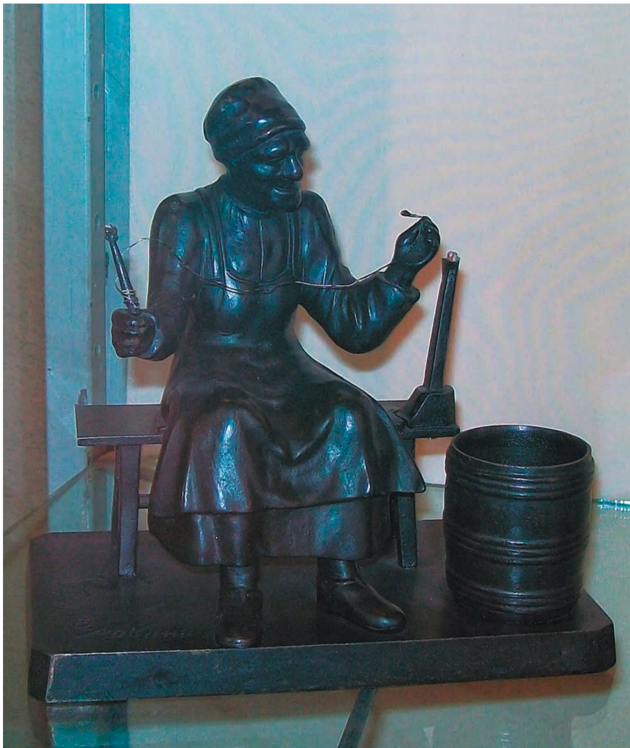
В.Ф.Торокин. Спичечница Старуха с прялкой. Отливка 1905 г. Чугун. 18х17х10 см. Каслинский историко-художественный музей.

– Ее пришлось продать. Я оставила себе две вещи на память, потому что изучаю философские темы. Это скульптура «Лев Толстой пашет» и фигура Христа, которая соответствует моим научным интересам.