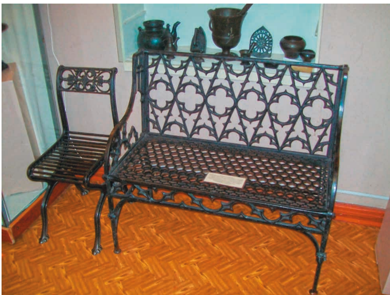
К.-Ф.Шинкель. Диван ажурный. Отливка кон. XIX – нач. XX в. Чугун. 90х44х97 см. Каслинский историко-художественный музей.