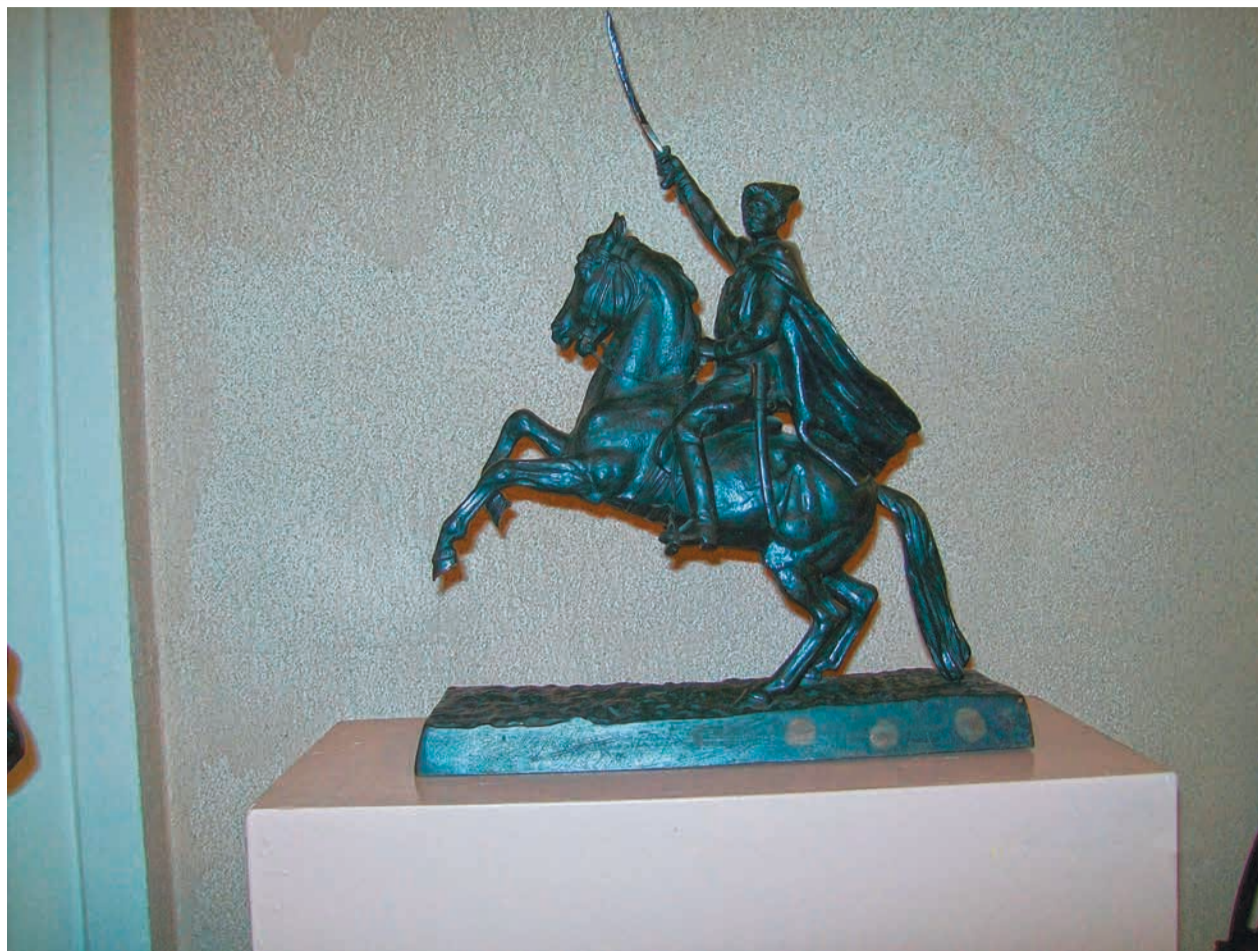
П.А.Баландин. В.И.Чапаев на коне. Отливка 1952 г. Чугун. 46x35,5x14,5 см. Каслинский историко-художественный музей.

С.А.Оссовская. Кавказский пленник. Отливка 2006 г. Чугун. 37x30x21,5 см. Каслинский историко-художественный музей.