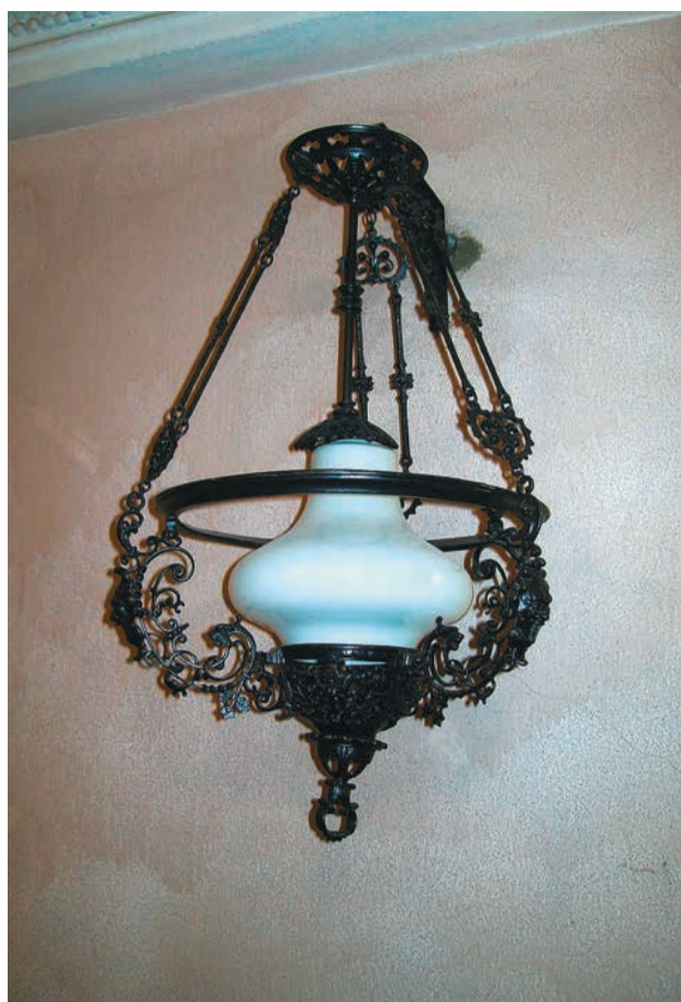
Неизвестный автор. Светильник ажурный с маскаронами, со стеклянным плафоном. Отливка 1993 г. Чугун. 76x47x47 см. Каслинский историко-художественный музей.