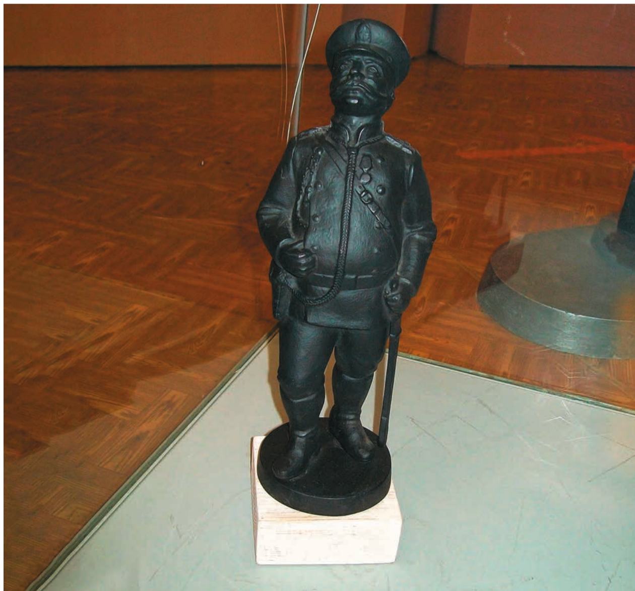
К.А.Гилев. Городовой. Отливка 2013 г. Чугун. 31x11,55x10 см. Каслинский историко-художественный музей.